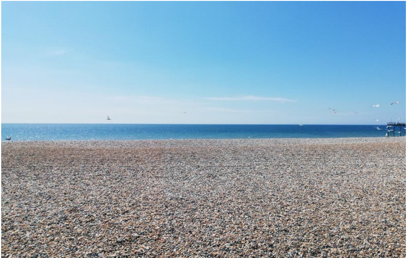
Kiesstrand in Bognor Regis.

Das Schöne daran, auf einer Insel zu leben, ist, dass das Meer niemals allzu weit entfernt ist. Für diesen Sommer haben meine Familie und ich uns darum entschieden, Urlaub in der Nähe zu machen.