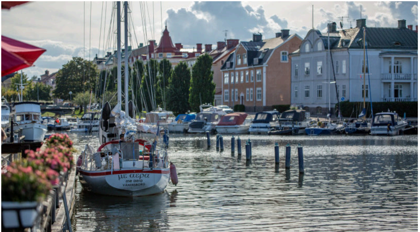
Blick auf Vänersborg ganz im Süden der Route.

Wer es sportlich mag, kann für den Rundweg 4 Etappen von je 140 bis 180 Kilometer einplanen.