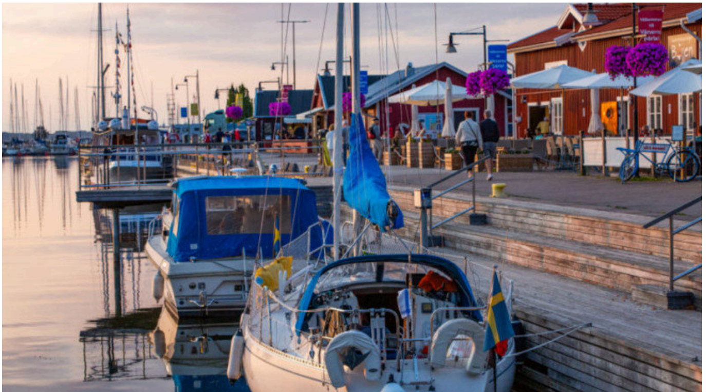
Am Hafen von Mariestad.