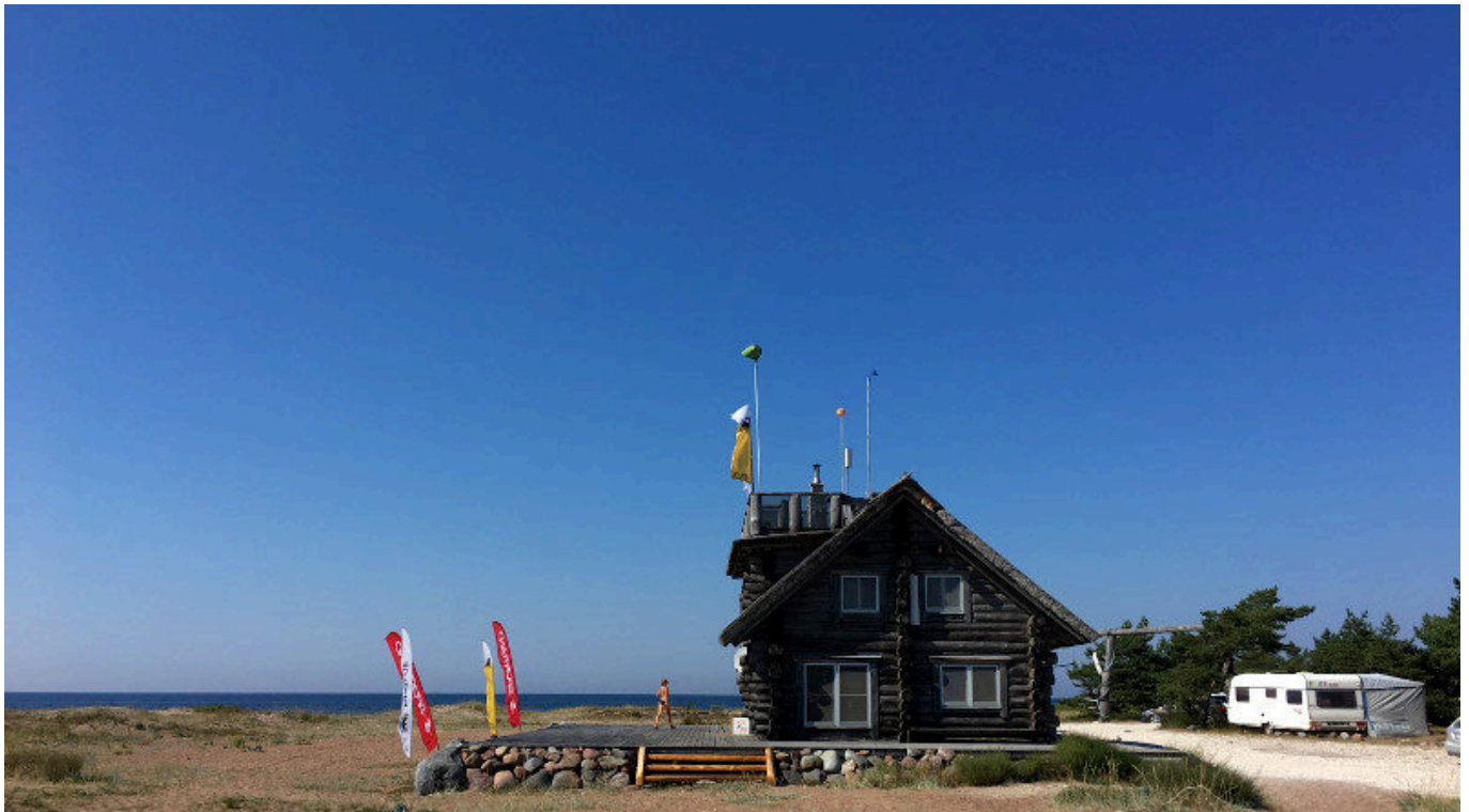
Die Homepage des Wassersport-Anbieters „Surf Paradiis“.

Tiefe. Wer vom Board gerissen wird, muss sich also eher keine Sorgen machen, schmerzhaft Bekanntschaft mit dem Untergrund zu machen.