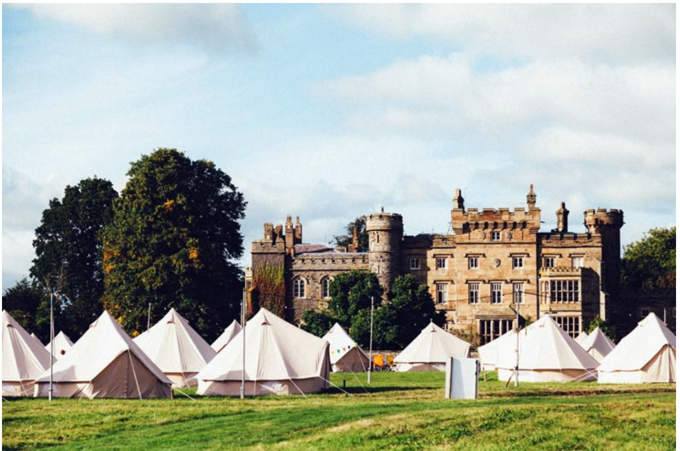
Festivalgelände auf dem Harwarden Estate.

In Wales wird im Frühherbst ein „Festival des guten Lebens“ gefeiert. Musik, Literatur, Handwerk und Design und Kochen im Erdloch - dieses Festival ist ein „Zurück zur Langsamkeit“. Zum vierten Mal findet das Festival The Good Life Experience im Norden von Wales statt, nahe der Grenze zu England.