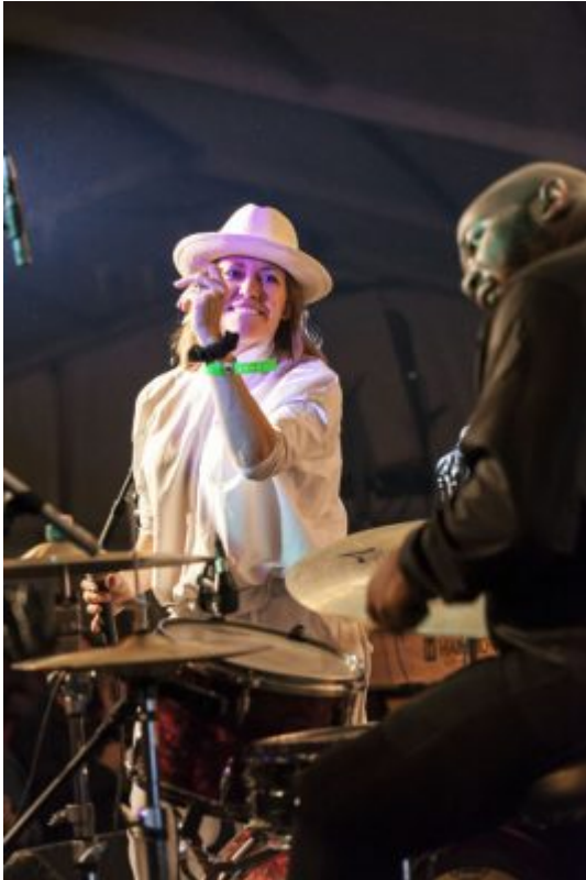
Cerys Matthews, Ideengeberin und Mitgründerin des Festivals auf der Bühne

Genau der richtige Nährboden für das Setzen eskapistischer Trends, für das Hochlebenlassen der guten alten, sicheren Zeit und der heilen Welt von anno dazumal. Mit diesem Konzept nach der Idee der Mitgründerin Cerys Matthews, Sängerin und Songschreiberin aus Cardiff, hat das Festival von Anfang an einen großen Zuspruch erhalten. Die Tatsache, dass es keinen Backstage- und keinen VIP-Bereich gibt, unterstreicht den Wunsch der Veranstalter, Teilnehmer und Gäste nach Gleichheit, Brüderlichkeit und Weltfrieden.