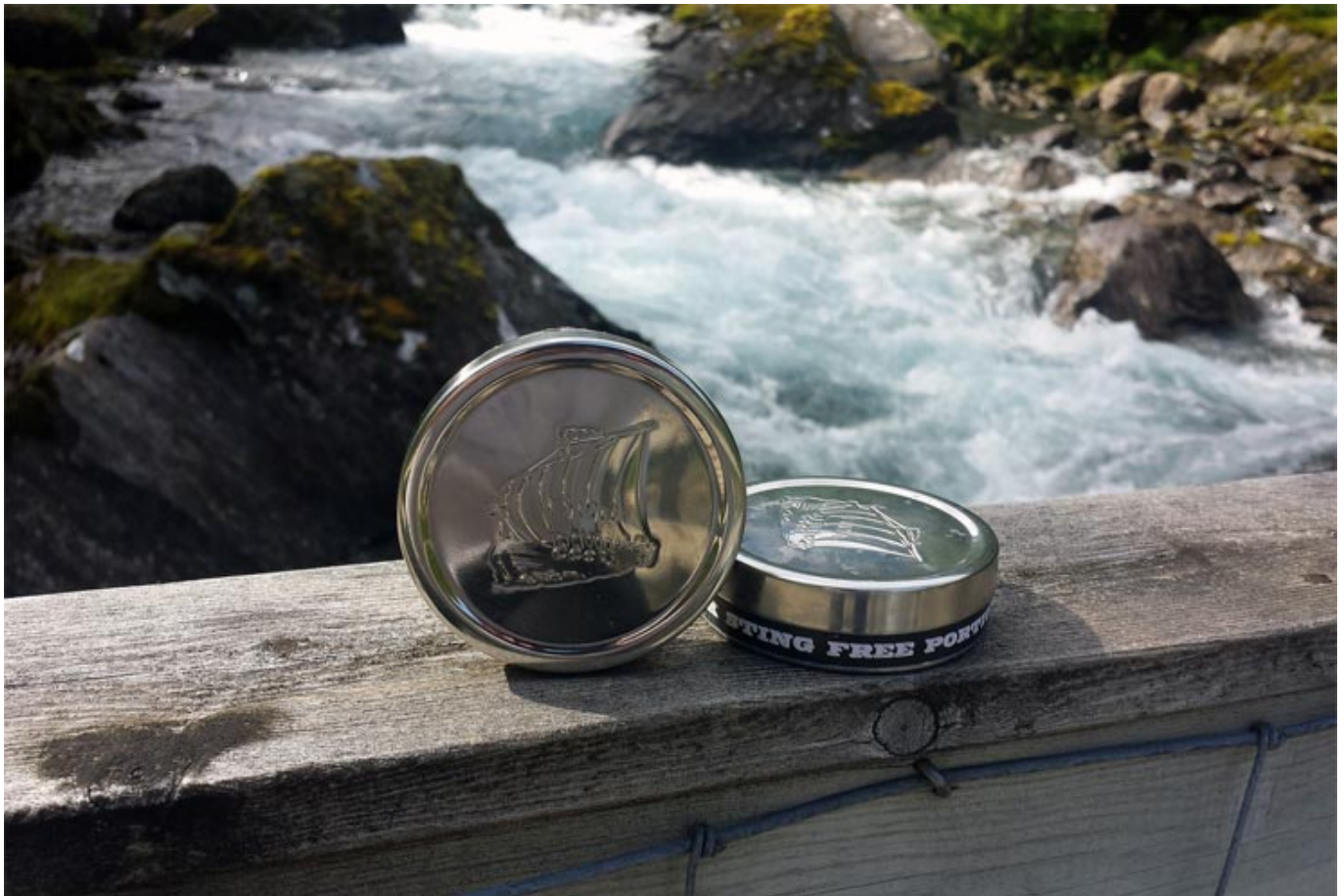
Eine Dose Snus. (Foto lizenzfrei)

Am vergangenen Donnerstag hat das norwegische Amt für Statistik (SSB) die aktuellen Zahlen zum Tabakkonsum veröffentlicht. Demnach hat der Konsum von Snus - eine Art Kautabak, der in Schweden und Norwegen beliebt ist - zum ersten Mal seit Erhebung der Zahlen in Norwegen den Gebrauch von Zigaretten überholt.