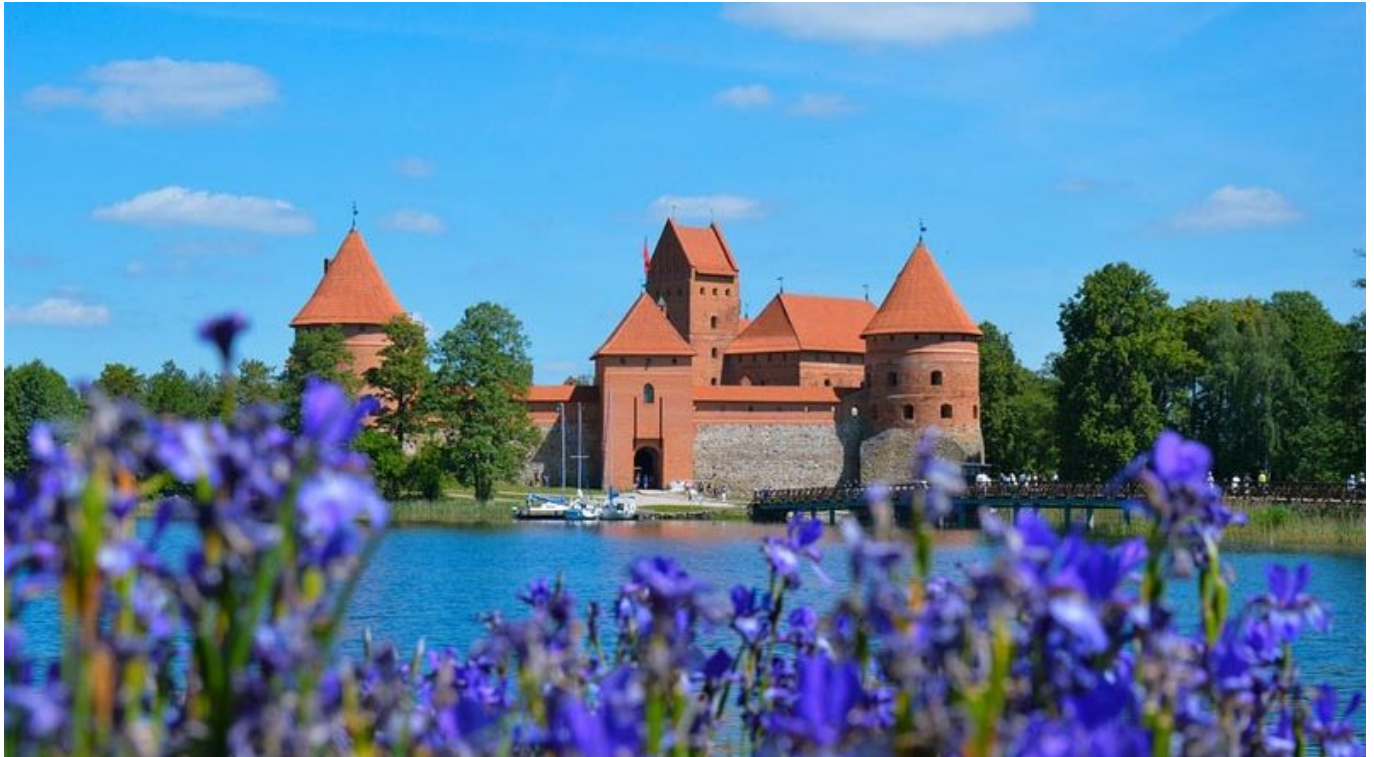
Die schöne Wasserburg zu Trakai .

Hierbei zeigt sich, dass der IT-Bereich aktuell mit einem durchschnittlichen Bruttolohn von monatlich fast 2.600 Euro recht deutlich an der Spitze steht. Halbwegs mithalten kann da nur das Finanz- und Versicherungswesen mit 2.450 Euro. Danach öffnet sich die Schere gewaltig.