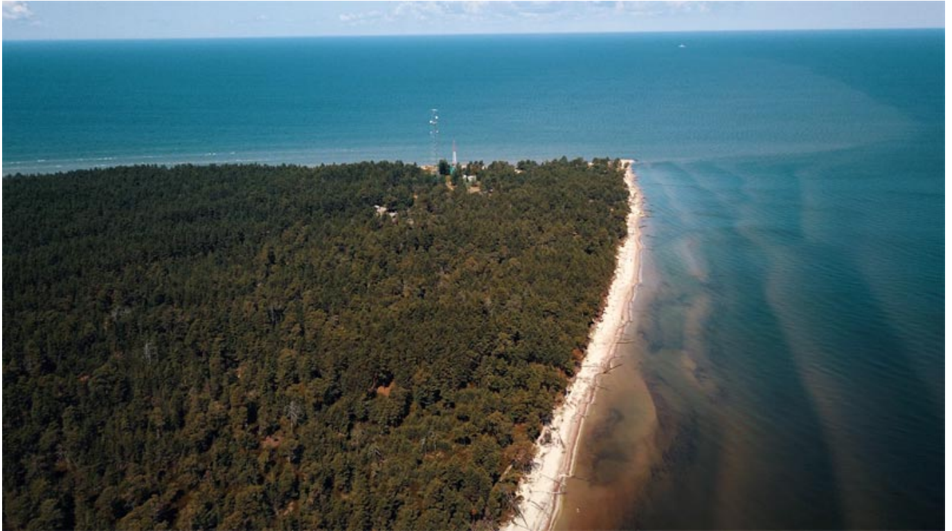
Kap Kolka.

Um den wachsenden Tourismus vor Ort zu fördern, wurden im und um den Nationalpark Slitere diverse wunderbare Wander- und Fahrradstrecken freigegeben. Einfach mit dem PKW anreisen, Rad auspacken – und es wartet ein herrlicher Tag an der frischen Seeluft. Denn egal, wo man sich im Slitere befindet: Die Ostsee ist immer ganz in der Nähe.