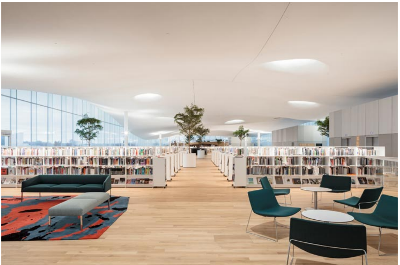
Leseraum im dritten Stock des Oodi.

Wenn man auf die neue Bibliothek Helsinkis zuläuft, denkt man eher an eine Konzerthalle oder ein Museum. 16.000 Quadratmeter. Viel Glas, viel Stahl und noch mehr Holz. Diese Bibliothek hat das Zeug, zum neuen Goldstandard in Sachen Bibliothekskultur zu werden. Darum kann man die Einwohner Helsinkis nur beneiden.