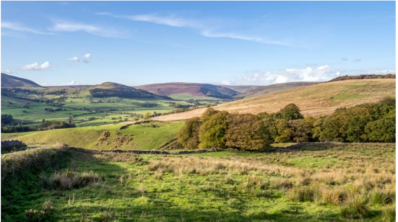
Forest of Bowland.

In Lancashire gibt es einige County Parks und mit Arncliffe and Silverdale sowie dem Forest of Bowland zwei Areas of Outstanding Natural Beauty , in denen man sich beim Wandern, Radfahren, Angeln oder Reiten unglaublich gut erholen kann. In der Stadt Preston befinden sich das National Football Museum und das Museum of Lancashire. Auch an der Küste von Lancashire gibt es einiges Sehenswertes: Einige ausgezeichnete Golfplätze sind Teil der sogenannten Golf Coast Englands und sind sowohl für Profis als auch für Amateure eine echte Herausforderung.