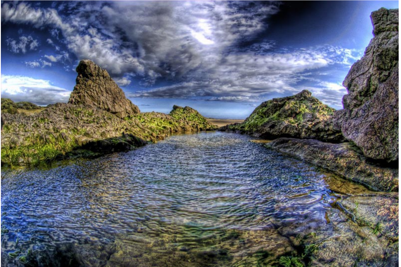
Silverdale Felsenlache.

An der Promenade von Morecambe kann man wunderschöne Aussichten genießen, und auch sonst bietet die Stadt mit ihren Bars, Restaurants und Hotels alle Vorzüge eines Küstenressorts. Das Mündungsgebiet des Flusses Ribble ist einer der wichtigsten Lebensräume für wild lebende Tiere und steht daher unter Naturschutz. Das Gebiet ist dennoch für Besucher zugänglich, und Naturliebhaber sollten sich die Möglichkeit eines Besuchs nicht entgehen lassen.