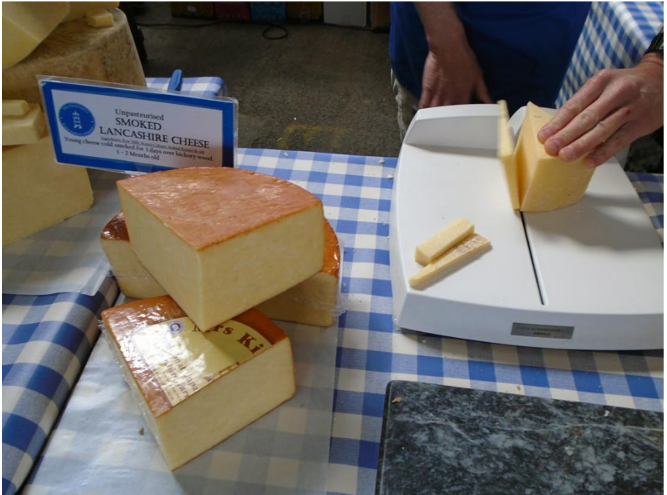
Geräucherter Lancashire Cheese.

Lancashire ist bekannt für seinen Käse, den Lancashire Cheese, der von vielen lokalen Farmen hergestellt wird. Er ist besonders zum Überbacken von Toast und Ähnlichem geeignet. Diverse Käsesorten aus Lancashire gewinnen regelmäßig britische Käse-Auszeichnungen. Immerhin. Eine weitere Spezialität ist der Lancashire Hotpot, eine Art Eintopf, der mit Lammfleisch, Kartoffeln und Zwiebeln zubereitet wird und von dem es auch eine vegetarische Variante, den Potato Hotpot, gibt. Beides sehr zu empfehlen.