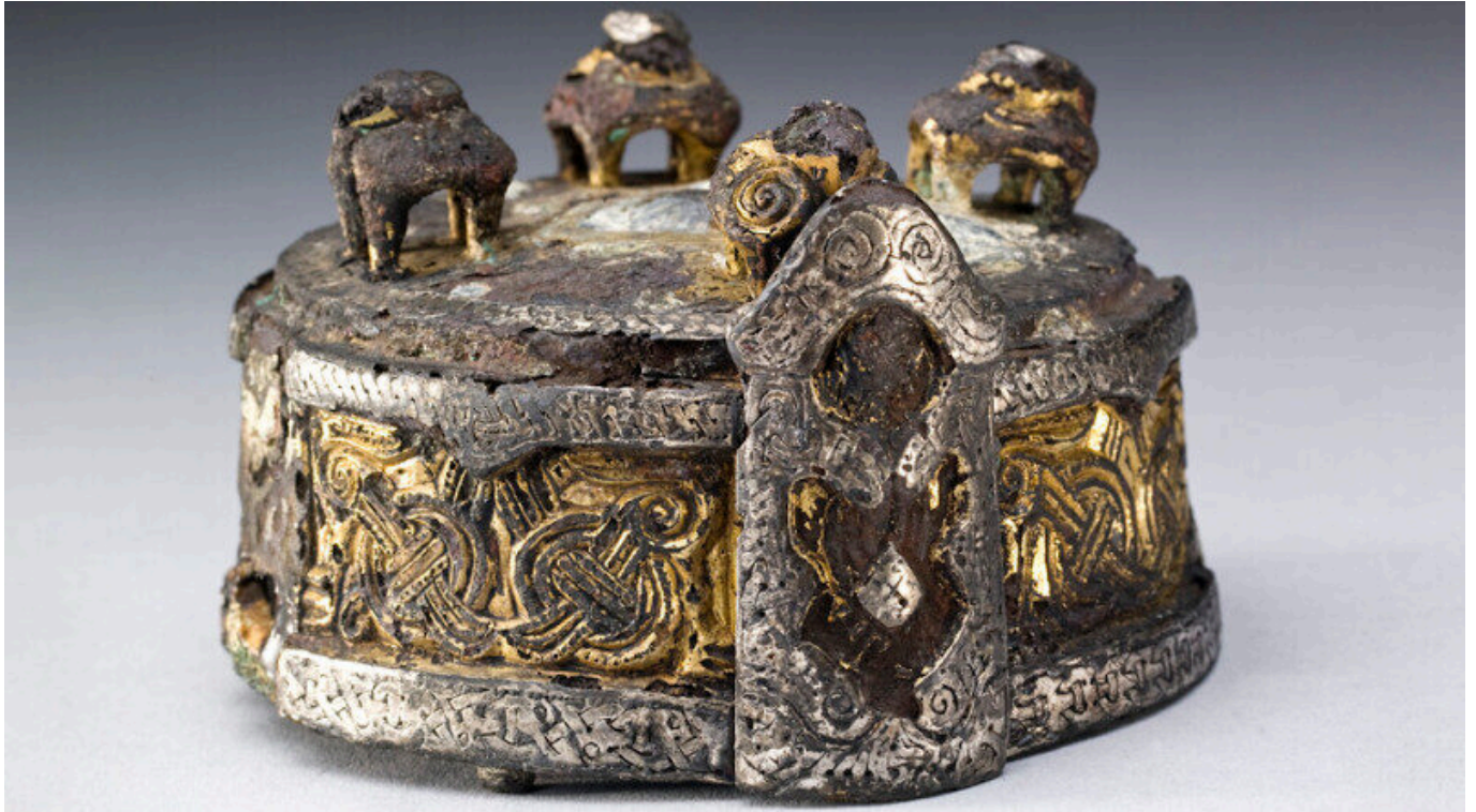
Gotländische Brosche / Fibel, gefunden in einem der 30 Gräber von Fyrkat.

Baulich gehören die Festungen zu den bedeutendsten archäologischen Überresten aus der Wikingerzeit in ganz Dänemark. Sie zeugten zur Zeit ihrer Errichtung von dem Bestreben, das Königreich einerseits zu einen und andererseits vor äußeren Feinden zu schützen.